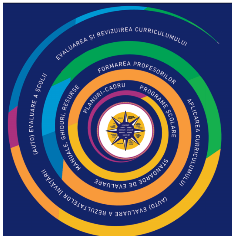
Figura 2**). Continuumul predare-învățare-evaluare

Continuumul predare-învățare-evaluare reunește elementele de construcție curriculară, de suport al curriculumului, de aplicare și evaluare a acestuia: