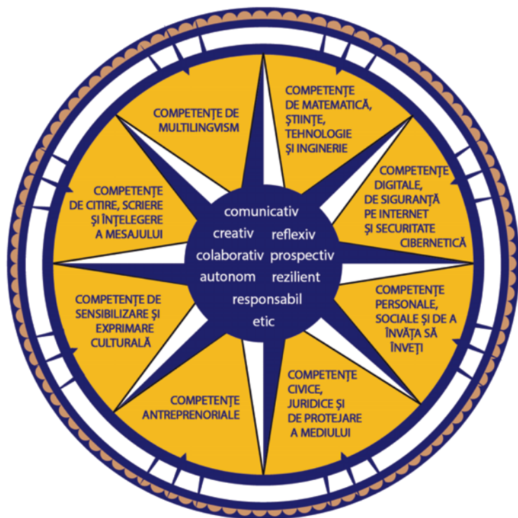
Figura 1*). Dimensiuni principale care contribuie la definirea profilului de formare al absolventului

Profilul de formare al absolventului funcționează ca o busolă pentru întregul sistem educațional, în care elementele continuumului predare-învățare-evaluare conlucrează pentru realizarea idealului educațional definit în lege.